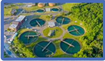
MONITOREO Y TRATAMIENTO DEL AGUA

Somos la exposición internacional en tecnología ambiental y economía circular más importante de México reuniendo las tecnologías, soluciones, productos y servicios más innovadores en los 4 sectores principales.