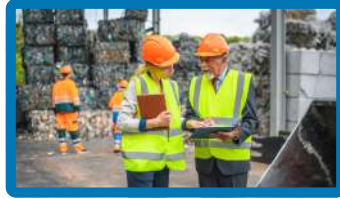
GESTIÓN DE RESIDUOS Y ECONOMÍA CIRCULAR