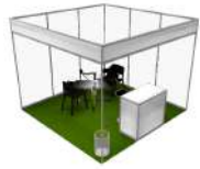
*Imagen de referencia para el stand equipado.

Incluye: alfombra estándar, mamparas divisorias, antepecho con rótulo en vinil, mobiliario estándar (counter, mesa y 2 sillas), 1 contacto eléctrico de 110v, gafetes de expositor (3 por cada 9 m 2 ), código de pre-registro de visitantes ilimitados para su compañía y mención en el directorio.